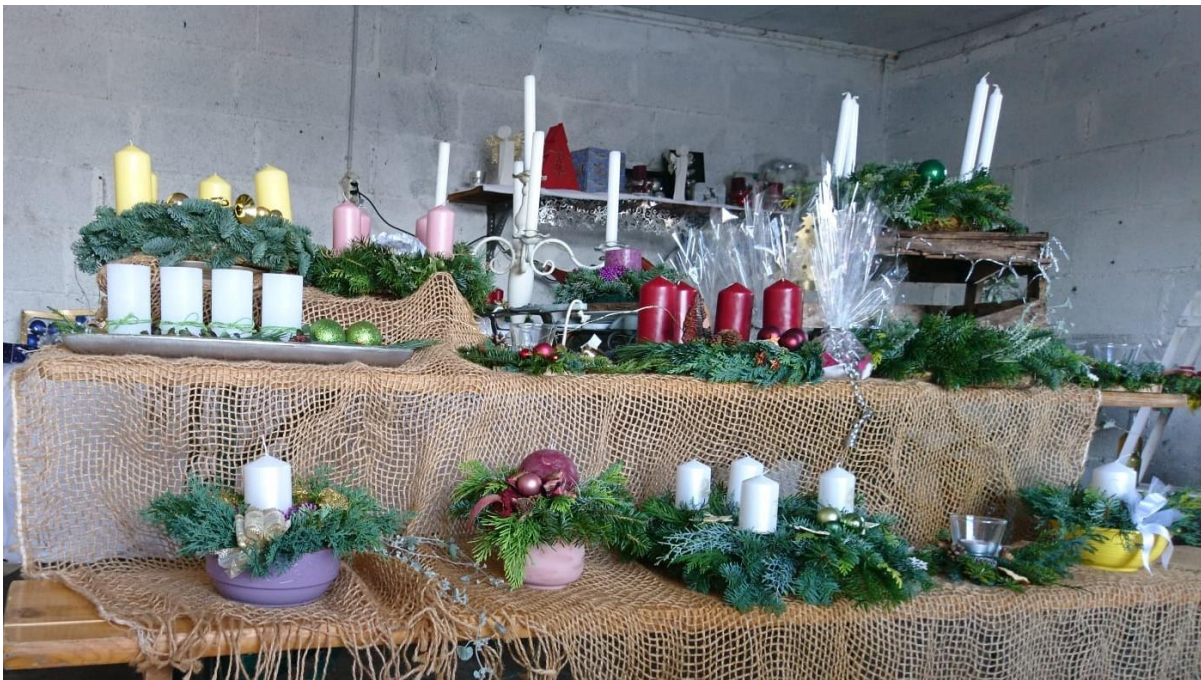
Weihnachtszauberstand Reutigen 2021

Am 27. November 2021 organisierten die Frauenvereine Reutigen und Höfen in der Broki Reutigen einen Weihnachtszauberstand mit Weihnachtsdeko, Backwaren und Allerei aus der Brocki. Der Erlös wird unserer Stiftung gespendet – ein grosses Dankeschön den engagierten und kreativen Frauen!