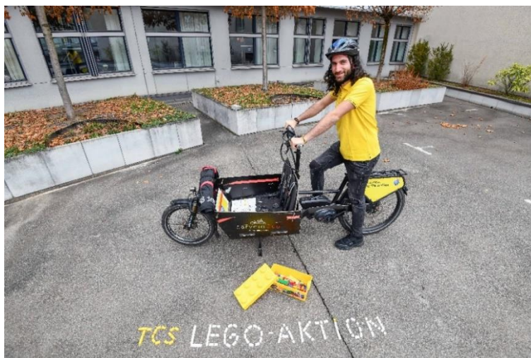
„Mobilitätsakademie des TCS“